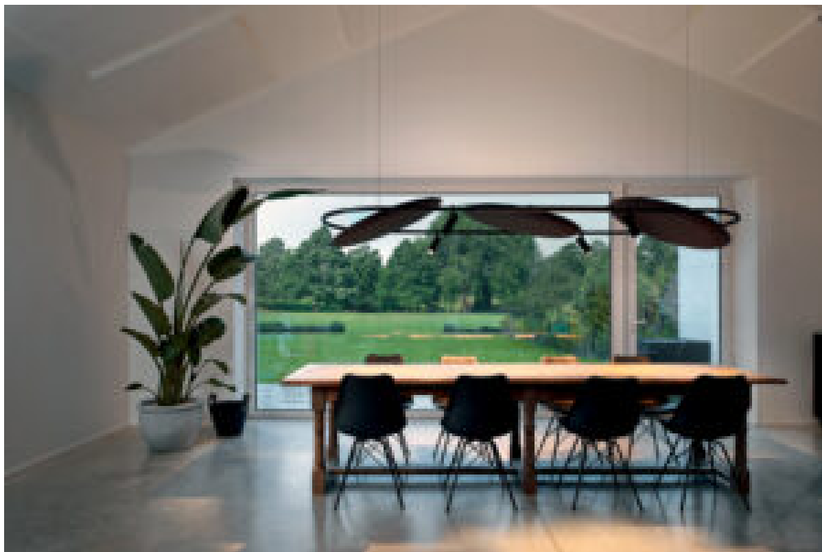
Soliscape utilizza una rete di sensori per rilevare i cambiamenti nell’attività, adattando

A garantirne la raccolta è una rete di sensori, capaci di registrare, in tempo reale e con continuità, sia il tipo di attività svolta che parametri ambientali come, ad esempio, la componente di luce naturale. Il resto è compito di un applicativo di intelligenza artificiale con il quale Soliscape analizza i dati e regola la luminosità, secondo un livello di comfort ottimale per le persone e per il contesto in cui si trovano.