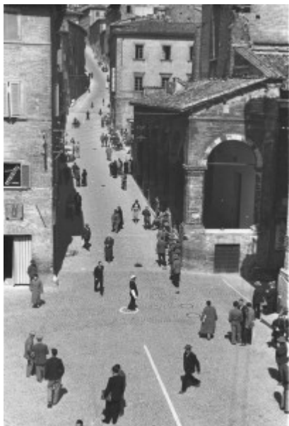
Urbino, il centro storico in una foto d'epoca