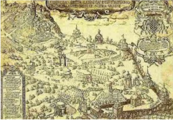
Il Sacro Monte di Varese

Nella sovrapposizione di luoghi c'è, spiega ancora Ferlenga, “un valore aggiunto che amplia le possibilità offerte dalle mostre e dà ulteriore senso di riflessione e scoperta alla rete immaginata da Triennale Xtra” . Fatto interessante, soprattutto in un momento di ripensamento e trasformazione del modello su cui la Triennale ha sviluppato finora la propria offerta culturale. Nel 2016 (dal 2 aprile al 12 settembre) è infatti programmata la 21° edizione della Triennale - a 20 anni di distanza dall'ultima , dal titolo «Identità e differenze». Da allora era prevalso un modello alternativo, caratterizzato da attività continua e produzione culturale quotidiana, con al suo interno un Museo del Design. In collaborazione con il Bie (il Bureau International des Expositions, organizzatore di Expo), si svilupperà il programma «XXI Secolo. Design after design» , diffuso in una serie di luoghi che affiancano quelli tradizionali del Palazzo dell'Arte e di Parco Sempione: dalla Fabbrica del vapore all'Hangar Bicocca, dai Campus del Politecnico a quello dello Iulm, dal Museo delle Culture alla Villa Reale di Monza. Iniziativa ambiziosa anche nel budget: circa 12 milioni, di cui 5 di finanziamento diretto della Triennale e dai contributi dei suoi partner e sponsor, 5 dalle quote di partecipazione e 2 dalle vendite dei biglietti.