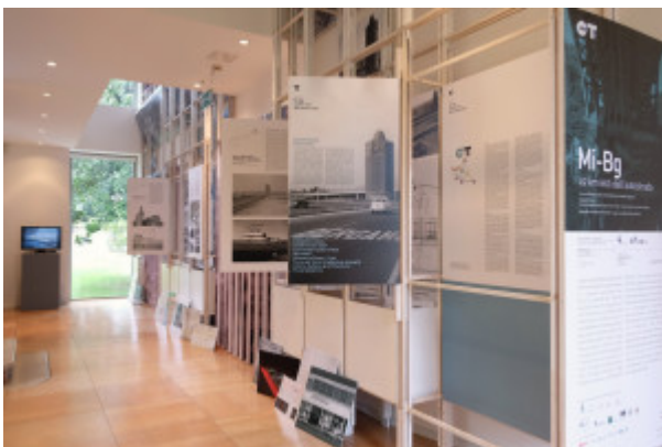
Un allestimento della mostra

Le migliaia di automobilisti che, dal 1927 a oggi, percorrono ogni giorno i 50 km dell'autostrada tra Milano e Bergamo, attraversano un territorio in continua evoluzione. L'ambizione della mostra - curata da Andrea Gritti, Paolo Mestriner e Davide Pagliarini e che si completa con alcune installazioni in spazi pubblici di Dalmine - è indagare il rapporto, emblematico e per tanti versi contraddittorio, tra il nastro di asfalto e i paesaggi che lo circondano.