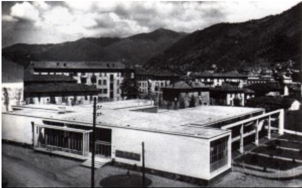
Giuseppe Terragni, asilo Sant'Elia a Como (1936)

nel tempo, anche in funzione delle successive novità legislative, delle prefigurazioni formali e delle visioni spazi inedite.