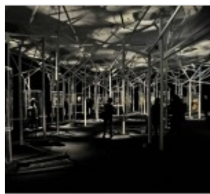
Interni, Milano 2002&2011, Ph. Roberto Chionne / J. 2012&2013