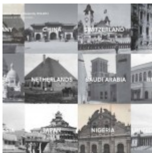
1 - Absorbing Modernity 1914

«Siamo nell'alfabetismo dell'architettura», decreta Baratta, «non sappiamo più cosa chiedere all'architetto. Dobbiamo tornare a esprimere desideri attraverso il ritorno dei fondamentali. Lo stesso vale per l'arte». Rappel à l'ordre che investe la Biennale d'un ambizioso ruolo: quello che il suo presidente definisce «di macchina desiderante».